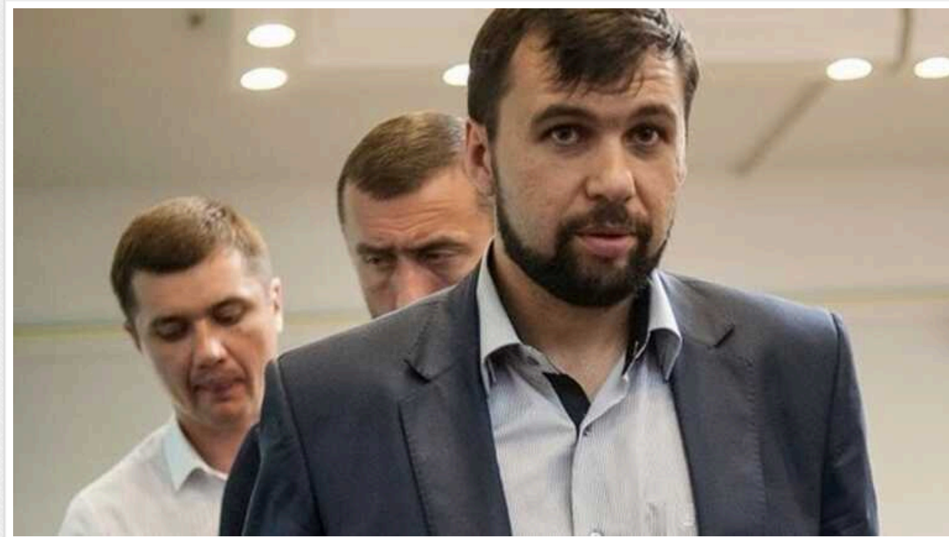
СБУ оголосила підозри Пушиліну та двом спільницям: депортували щонайменше 31 дитину з Донбасу до РФ

СБУ заочно повідомила про підозри "голови ДНР" Денису Пушиліну та його спільницям Елеонорі Федоренко та Світлані Майбороді, які депортували з тимчасово окупованих територій Донеччини щонайменше 31 українську дитину до пансіонату, що входить до структури управління справами російського диктатора Володимира Путіна.