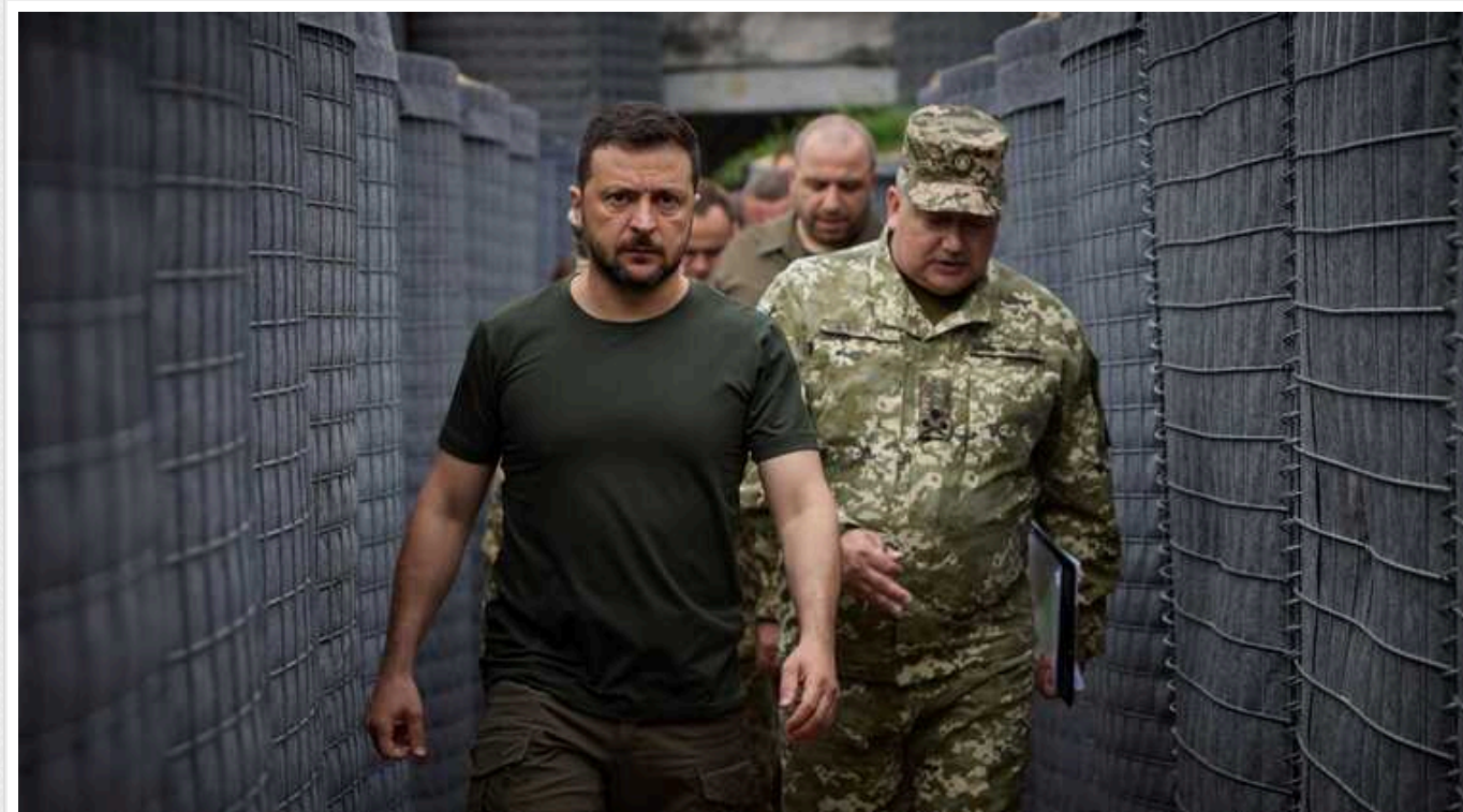
Financial Times: Українське суспільство «виснажене», навіть військові на фронті хочуть переговорів із РФ