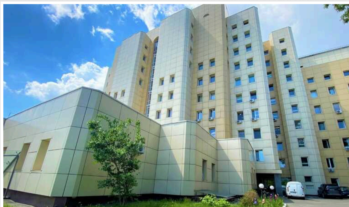
АМКУ зобов'язав поновити в тендері Інституту раку дешевого конкурента Біркадзе

Комісія Антимонопольного комітету України, яка займається розглядом скарг, 26 вересня зобов'язала ДНП «Національний інститут раку» скасувати рішення про відхилення найдешевшого учасника відкритих торгів, що стосуються проектування третьої черги реконструкції будівель інституту в Києві, очікувана вартість яких становить 15,23 млн грн.