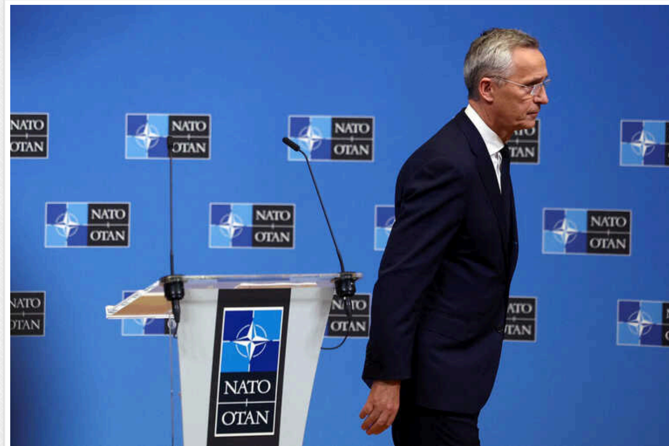
Генсек НАТО Столтенберг, який йде з посади, заявив, що Україна може вступити до НАТО тільки з підконтрольними територіями