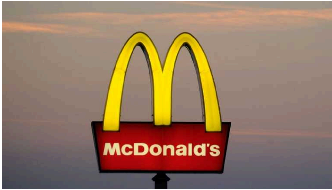
McDonald's купував рабів у мафії, щоб закрити нестачу робочих місць - злочин розкрили поліцейські в Британії

У 2015 році банда братів Древенаци шукала бездомних та безробітних чоловіків у Європі та, обіцяючи прибутковий підрібок, переправляла до Великої Британії.