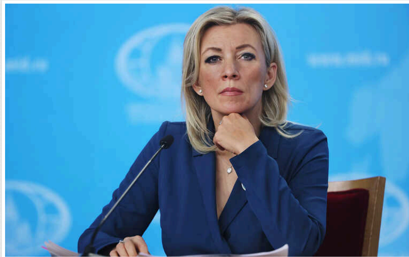
У РФ жителі Суджі спростували фейк Захарової про «український концтабір» у місті

Жителі Суджі (Курська область РФ), яка контролюється українськими військовими, у категоричній формі спростували фейк спікерки МЗС РФ Марії Захарової про те, що в їхньому місті «Україна організувала концтабір».