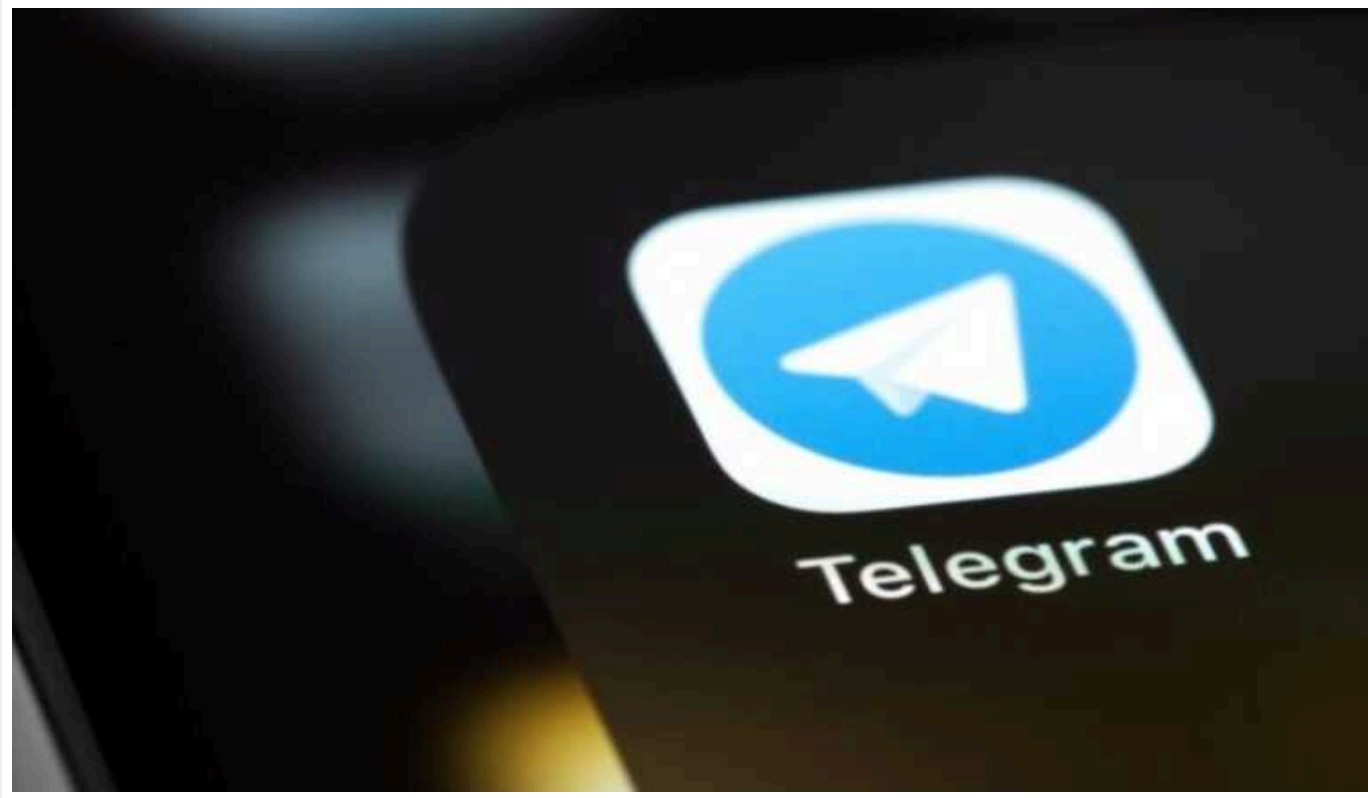
WSJ: Telegram став «мисливськими угіддями» для злочинців і поліцейських