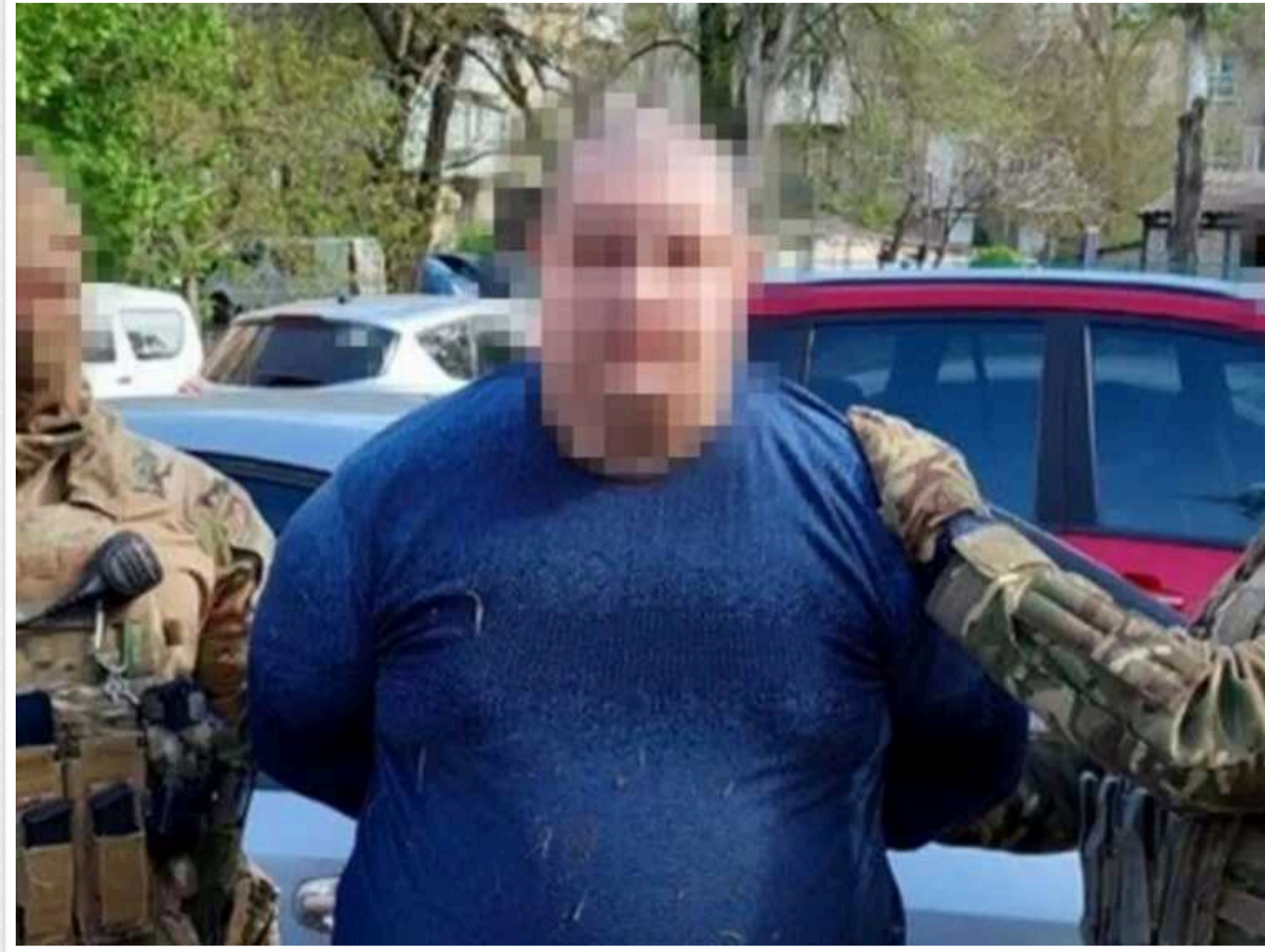
Ватажок агентурної групи ФСБ, яка готувала теракти в Запоріжжі, отримав довічний термін

Ватажок агентурної групи ФСБ РФ, визнаний винним у підготовці терактів проти сил оборони в Запоріжжі, отримав покарання у вигляді довічного ув'язнення. 52-річний мешканець міста з прокремлівськими переконаннями був завербований наприкінці 2022 року й за вказівкою ворога шпигував за місяцями розташування командування Збройних сил України, а також спецпризначенців Служби безпеки України.