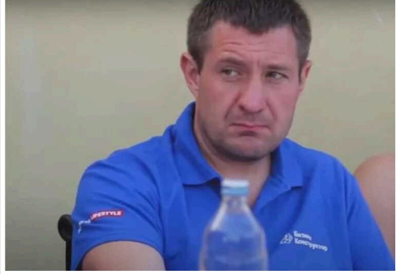
Хто допоміг втекти за кордон прямо із суду ексзаступнику міністра Авер'янову і чи відповідь він за розкрадання держбюджету в інших кримінальних справах?

Як повідомляв «Супільне», Чернігівський апеляційний суд засудив колишнього заступника міністра з надзвичайних ситуацій Олега Авер'янова до семи років позбавлення волі. Після цього Авер'янов зник – атік за кордон.