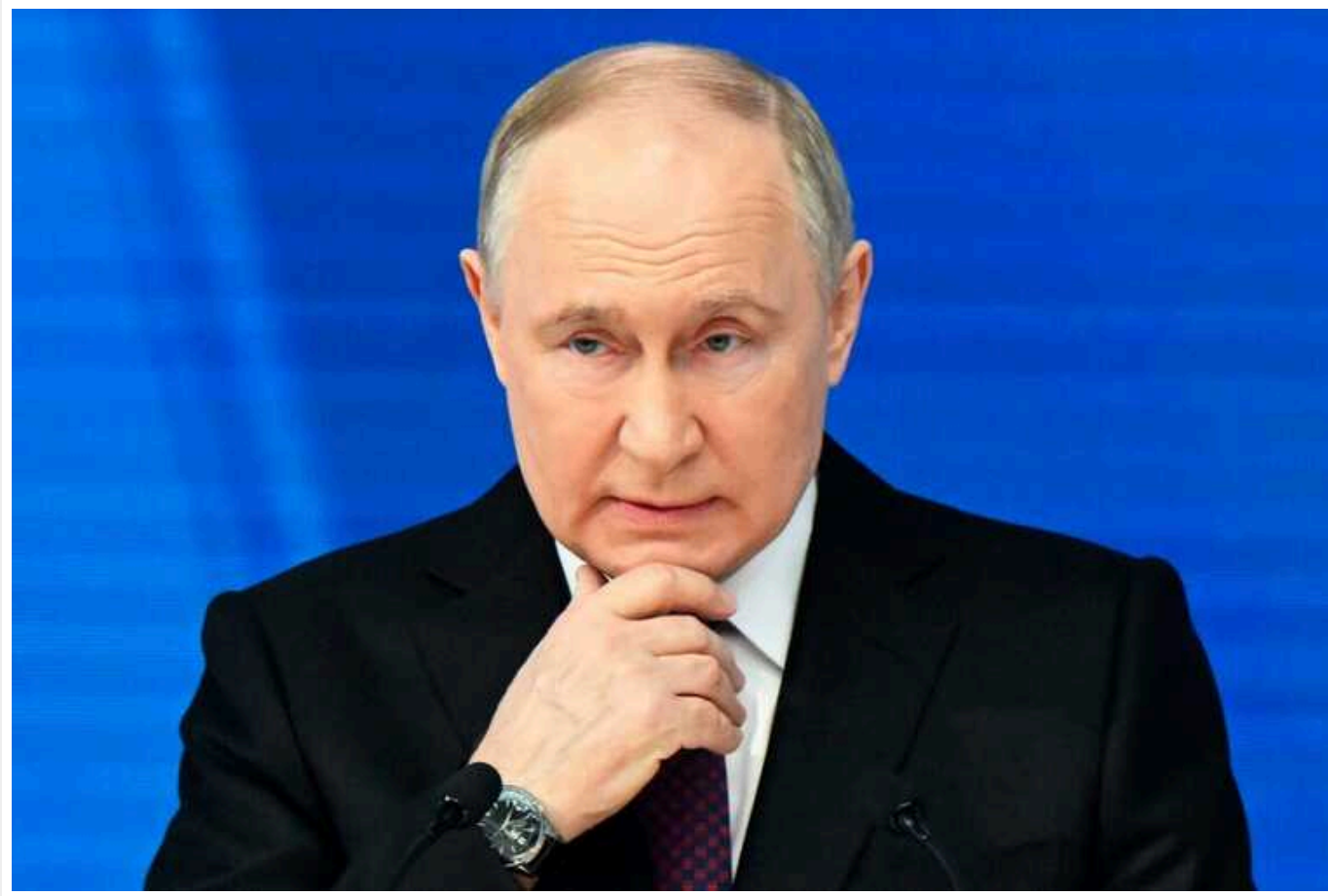
Путін привітав росіян із річницею окупації територій України

За словами керівника Кремля, "Росія не залишила своїх братів і сестер" на окупованому Донбасі, для якого РФ нібито є "історичною Батьківщиною".