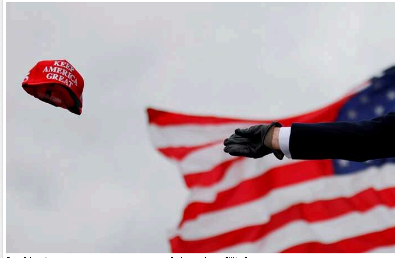
Республіканці готуються оскаржувати результати виборів президента США, - Reuters

Республіканці планують оскаржувати результати президентських виборів у США через судові інстанції.