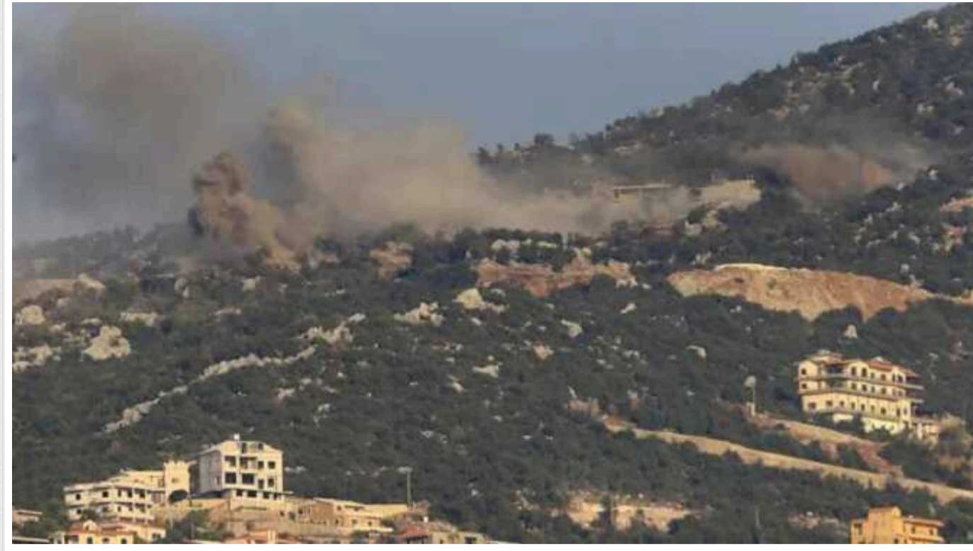
Ізраїль може почати наземне вторгнення до Лівану вже цього тижня, - WSJ

Ізраїль може почати наземне вторгнення в Ліван вже цього тижня, повідомляє Wall Street Journal, посилаючись на джерела, знайомі з ситуацією.