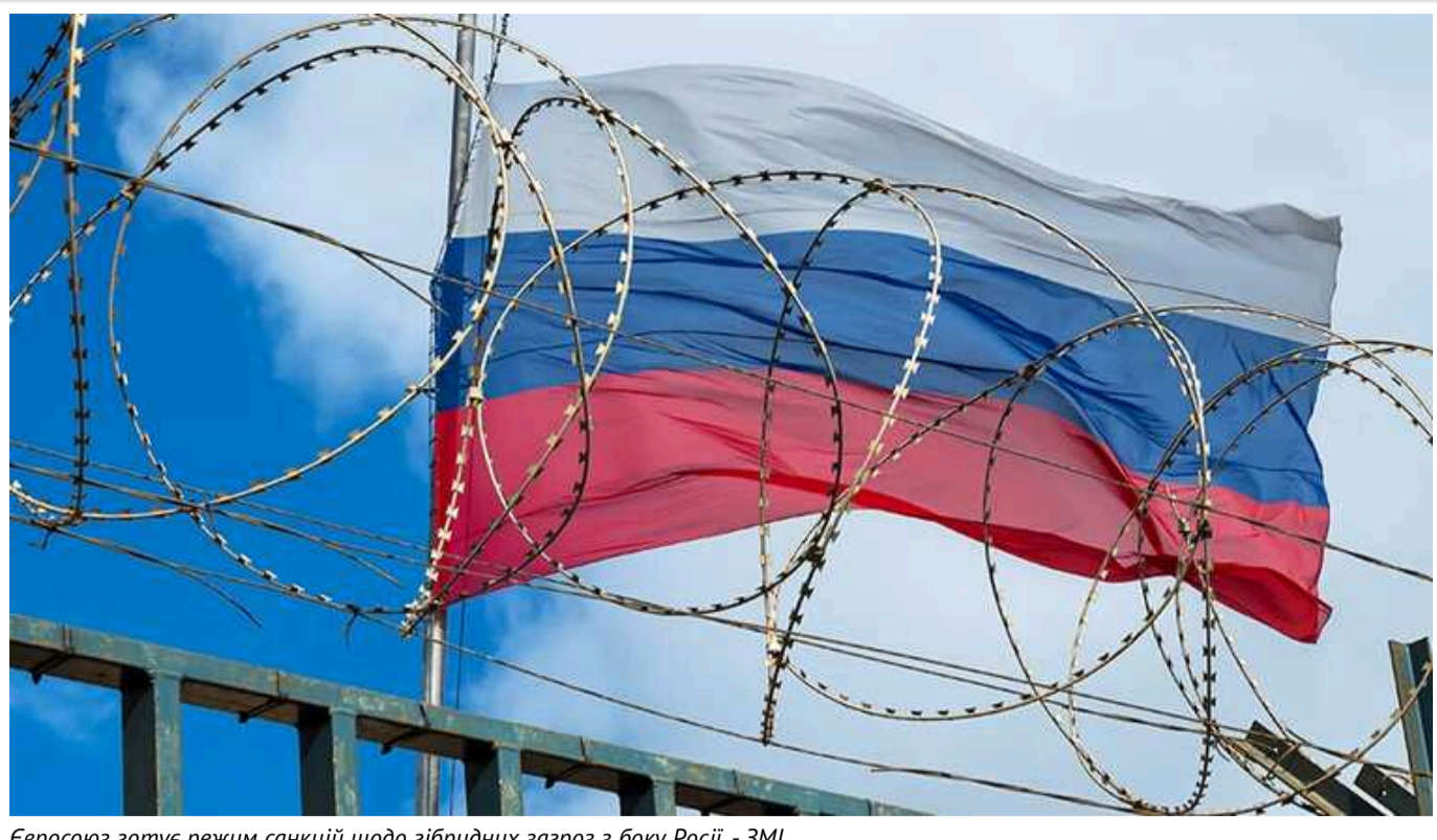
Євросоюз готує режим санкцій щодо гібридних загроз з боку Росії, - ЗМІ

Європейській Союз ухвалив рішення запровадити тематичний режим санкцій, що буде присвячений гібридним загрозам з боку Росії.