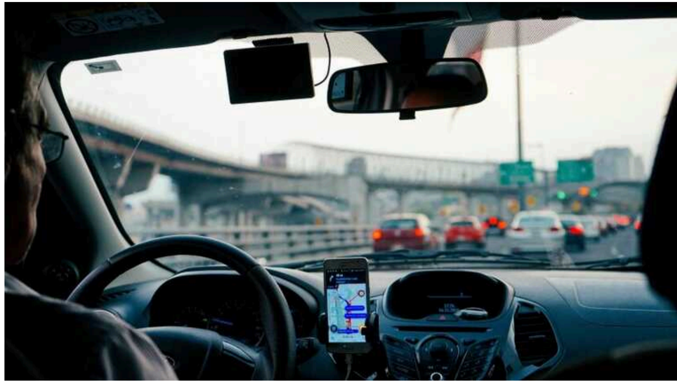
У Німеччині запроваджують нові правила для українських біженців із авто

У Німеччині завершився пільговий період реєстрації автомобілів для українських біженців. З 1 жовтня 2024 року вони зобов'язані зареєструвати свої транспортні засоби на німецькі номерні знаки. Це нововведення стосується тих українців, чий автомобіль перебуває в Німеччині понад 12 місяців.