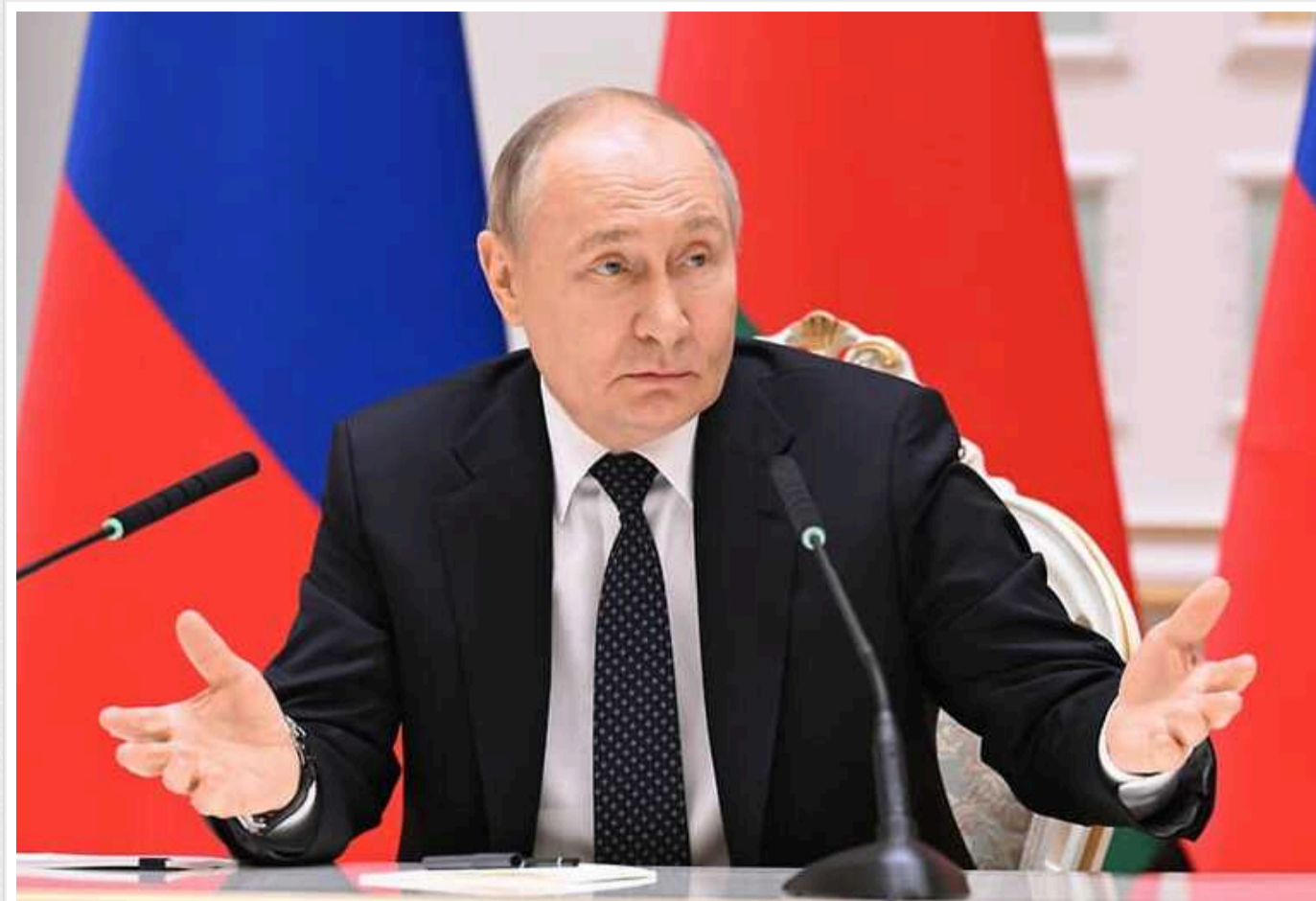
В ISW пояснили, чого боїться Путін на тлі збільшення витратів на оборону

Уряд країни-агресорки Росії має намір суттєво підвищити витрати на оборону у 2025 році. При цьому кремлівські чиновники запланували збільшити фінансування соціальних програм.