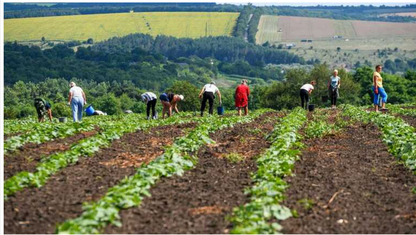
Вартість землі в Україні може зрости на 20% у найближчі роки, – міністр агрополітики Коваль

Про це заявив міністр агрополітики Віталій Коваль.