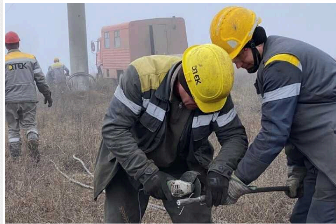
Енергетики щодня після обстрілів лагодять енергетичну інфраструктуру Покровська

Фахівці ДТЕК щодня ремонтують енергетичну інфраструктуру Покровська після обстрілів, щоб місто отримувало електроенергію.