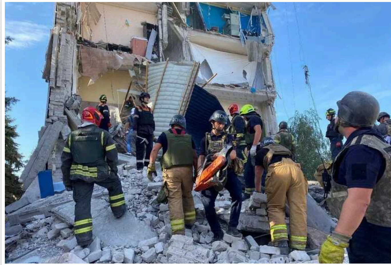
Пошуково-рятувальні роботи в Кривому Розі завершено: 4 людини загинули, 3 постраждалих ще в лікарнях

Пошуково-рятувальні роботи в місті Кривий Ріг Дніпропетровської області, що розпочалися після удару російських окупантів по адміністративній будівлі поліцейського управління, завершено, повідомив голова Дніпропетровської обласної адміністрації Сергій Лисак у суботу.