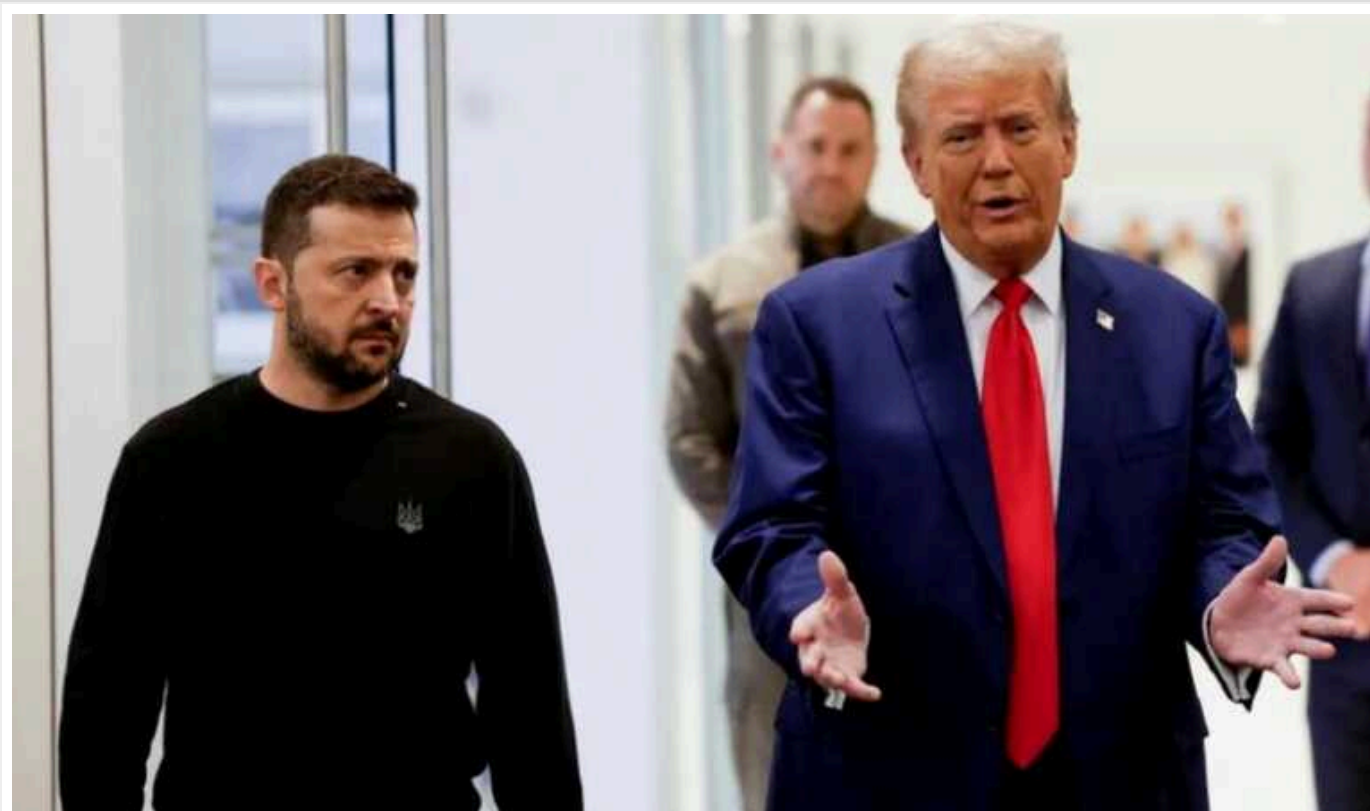
Видання Der Spiegel негативно оцінило підсумки поїздки Зеленського в США

Видання повідомляє про «жах на обличчі Зеленського» під час його зустрічі з Трампом.