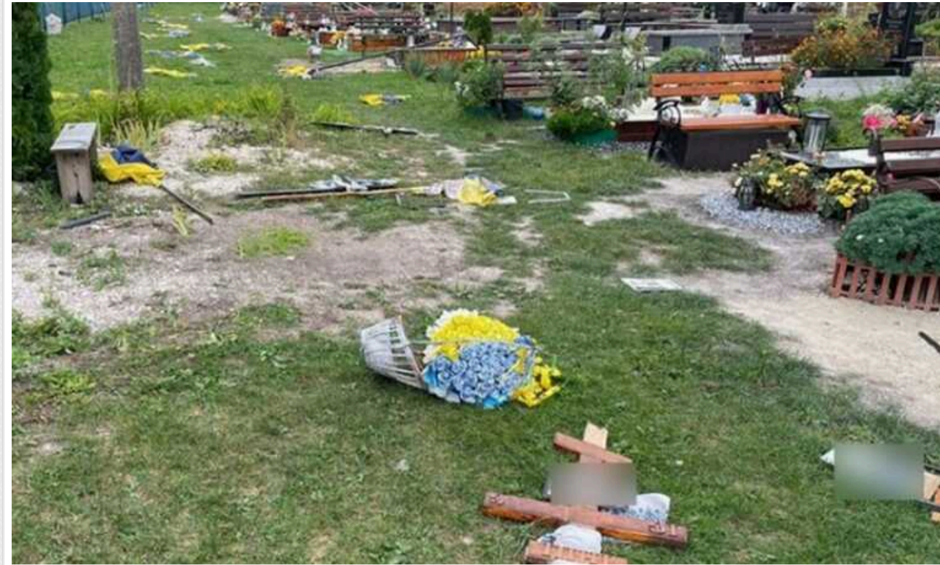
На Тернопільщині затримали вандала, який пошкодив 11 могил військових

У Тернопільській області 44-річний чоловік пошкодив могили військових. Його затримали працівники правоохоронних органів.