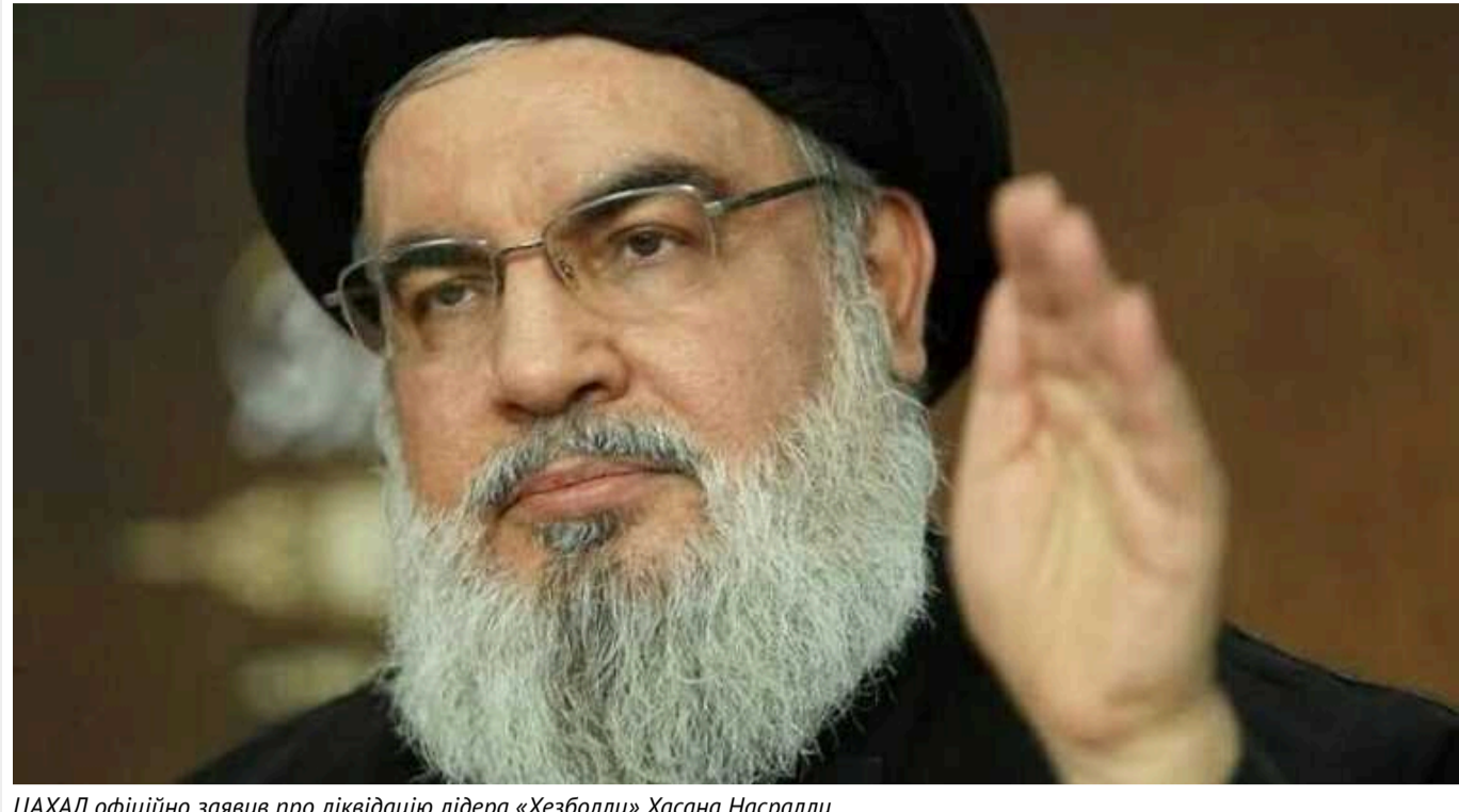
ЦАХАЛ офіційно заявив про ліквідацію лідера «Хезболли» Хасана Насралли

Він був ліквідований внаслідок авіаудару ізраїльської армії, який стався вчора в столиці Лівану Бейруті.