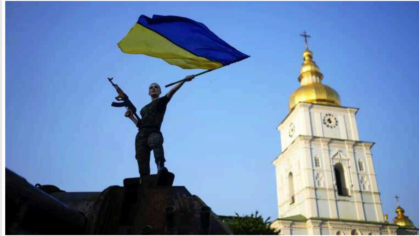
Автор The Spectator Оуен Метьюз опублікував колонку із заголовком «Як виглядає «перемога» України?»

«Як виглядає «перемога» України?», – колонку з такою назвою опублікував автор The Spectator Оуен Меттьюз.