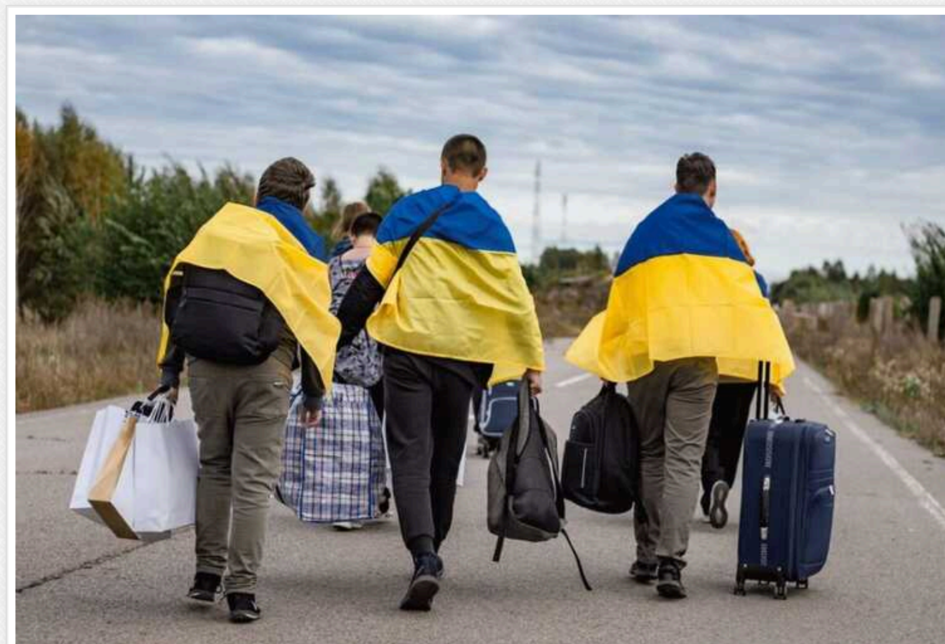
Україна повернула з окупованих територій ще групу дітей

Україна змогла повернути з тимчасово окупованих територій ще дев'ять підлітків віком від 13 до 17 років і двох юнаків. Деякі з цих молодих українців мають інвалідність і серйозні захворювання.