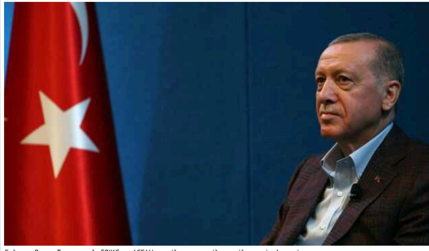
Ердоган: Вступ Туреччини до БРІКС та АСЕАН не свідчить про відмову від участі в Альянсі

Вступ Туреччини до таких організацій, як БРІКС та АСЕАН, змінить "арифметику регіонів", але це не означає відмови від членства в НАТО.