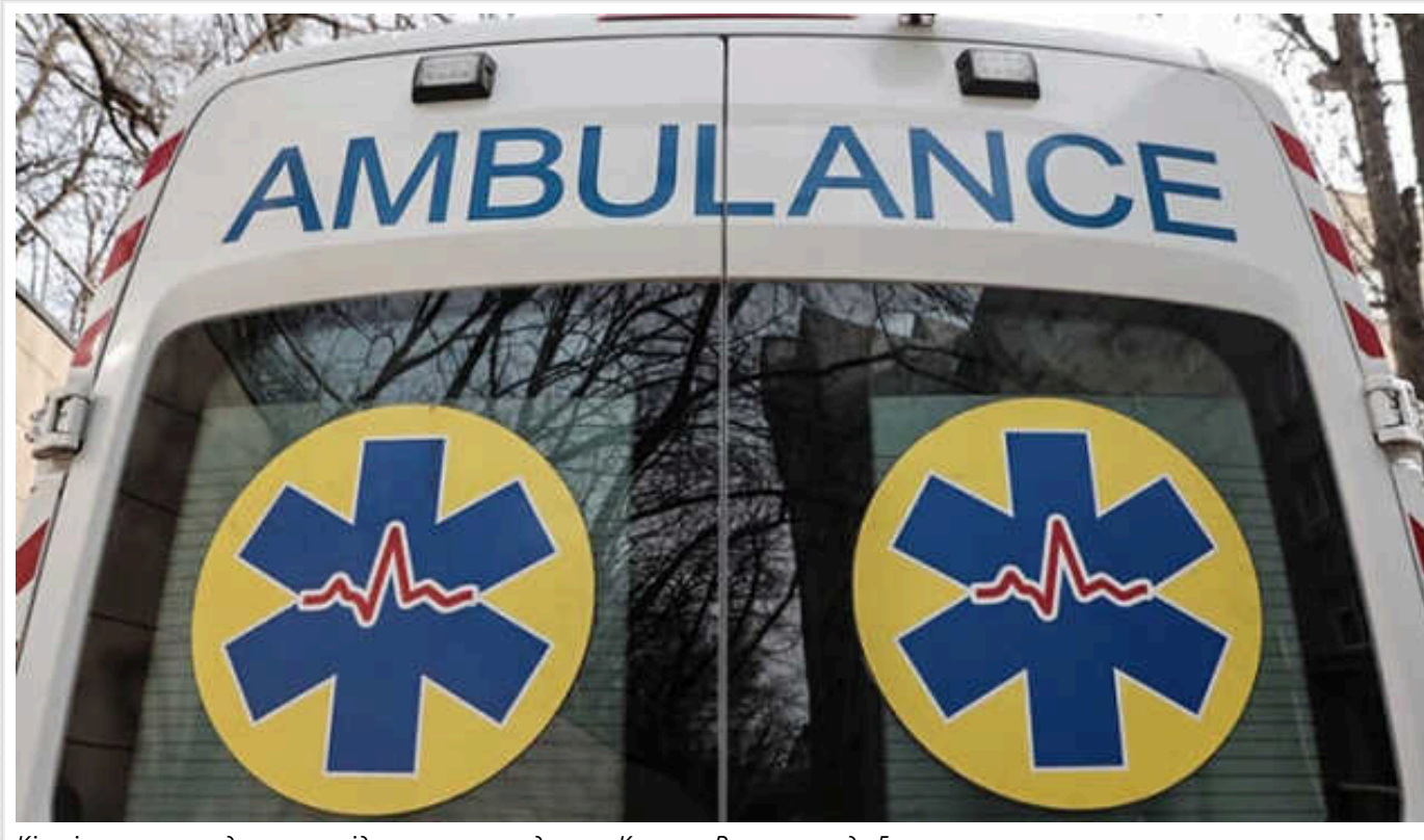
Кількість постраждалих внаслідок ракетного удару по Кривому Рогу зростає до 5

Кількість постраждалих внаслідок ракетного удару РФ по Кривому Рогу зростає до п'яти.