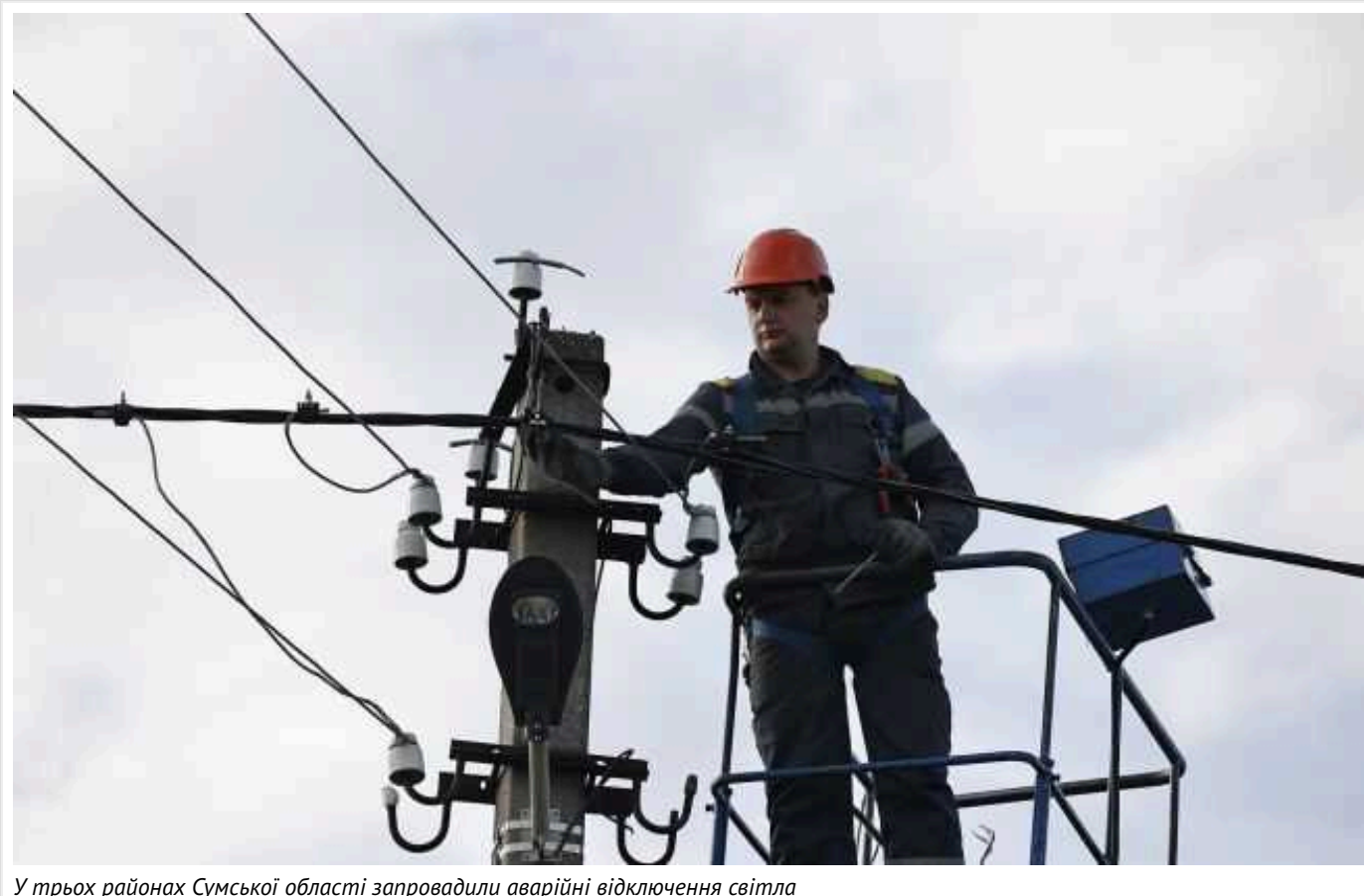
У трьох районах Сумської області запровадили аварійні відключення світла

У Сумській області в п'ятницю, 27 вересня, були запроваджені аварійні відключення електрики. Вони не охоплюють весь регіон.