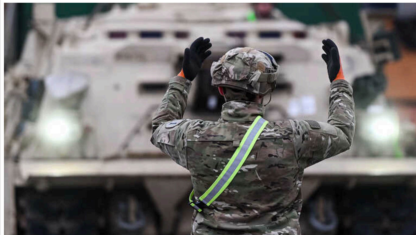
Військові постачання Україні на наступний рік під ризиком, оскільки деякі союзники не готові збільшити фінансування

Про це повідомляє Bloomberg із посиланням на джерела.