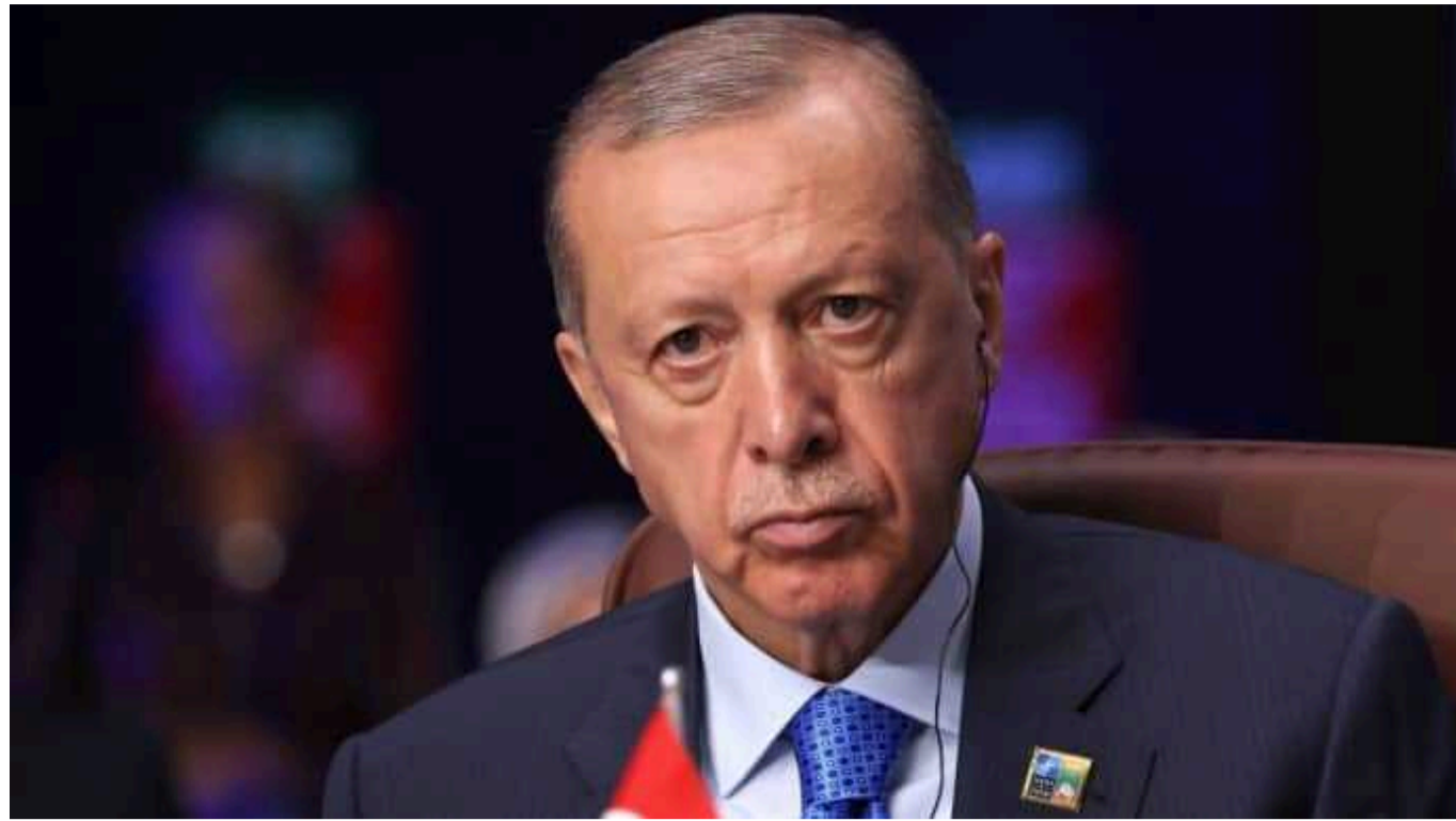
Ердоган висловив надію на участь Туреччини в другому Саміті миру

Президент Туреччини Реджеп Тайп Ердоган заявив, що його країна готова брати участь у другому Саміті миру, організованому Україною. Він вважає, що війну можна завершити шляхом дипломатії.