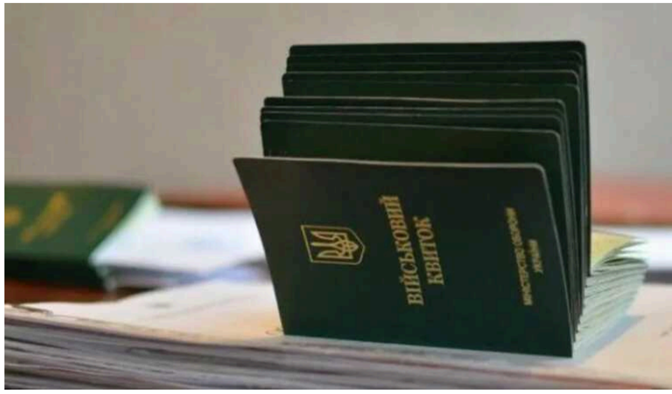
Міноборони готує нову реформу для призовників

Міністерство оборони розробляє нову реформу для призовників. У відомстві планують впровадити електронний кабінет, скасувати комісії та медичний огляд.