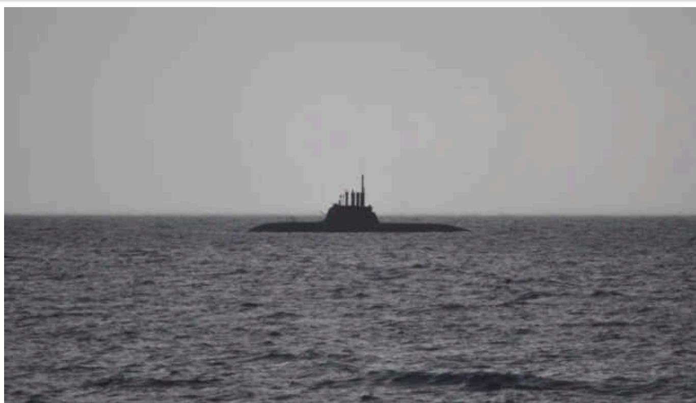
WSJ: У КНР затонув новітній атомний підводний човен

Навесні цього року в Китаї біля пірса суднобудівного заводу затонув новітній атомний ударний підводний човен ВМС КНР.