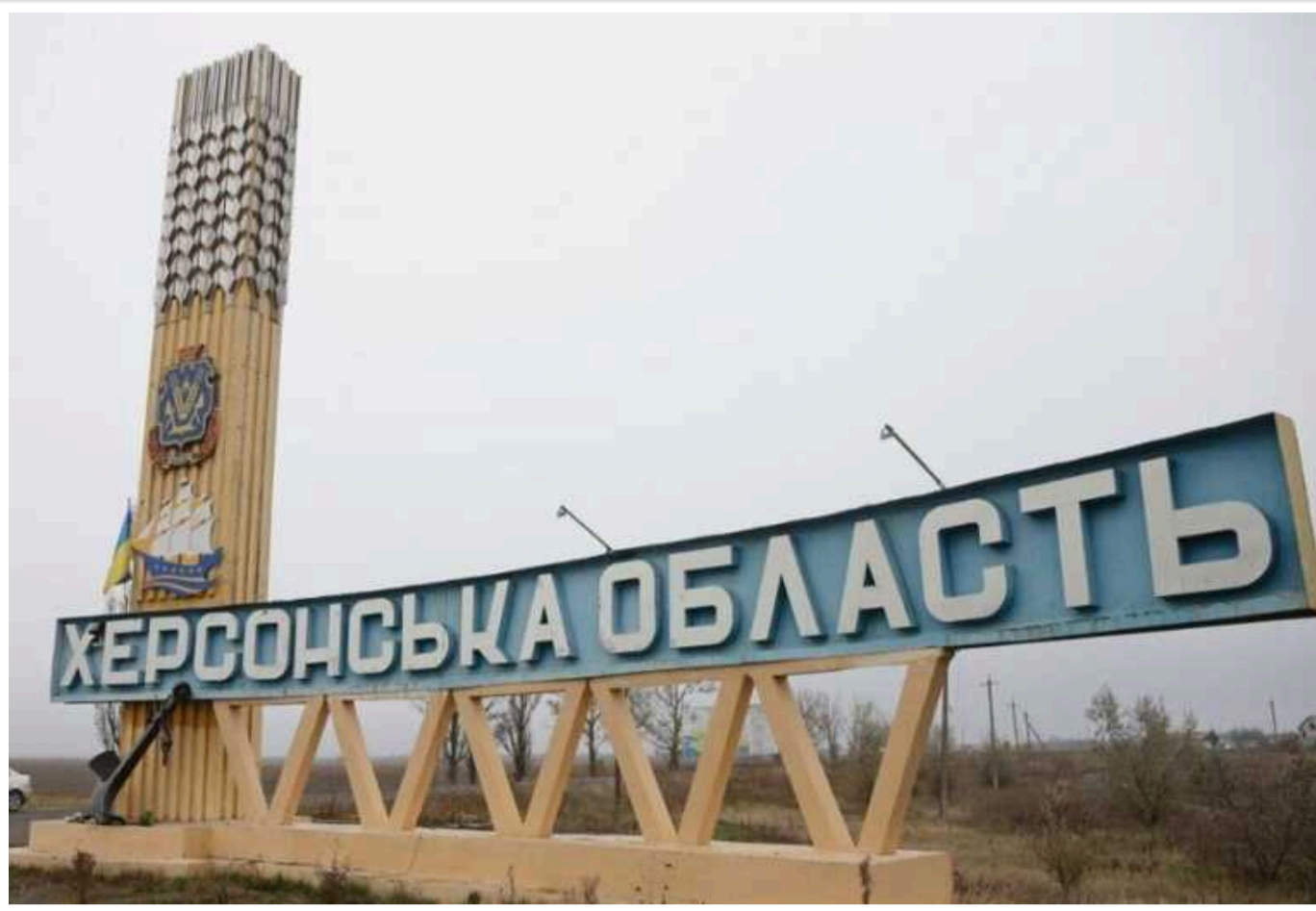
Окупанти обстріляли селище на Херсонщині: загинула 1 людина

Увечері 26 вересня російська армія атакувала селище Томина Балка на Херсонщині. Унаслідок обстрілу є жертви та поранені.