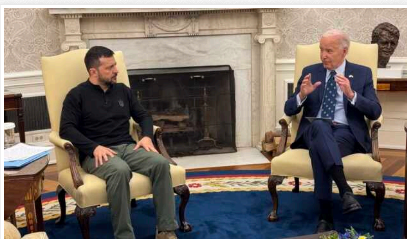
Зеленський висловив подяку Байдену за його керівництво у підтримці України

Володимир Зеленський висловив подяку Джо Байдену, Конгресу США та всьому американському народу за підтримку України.