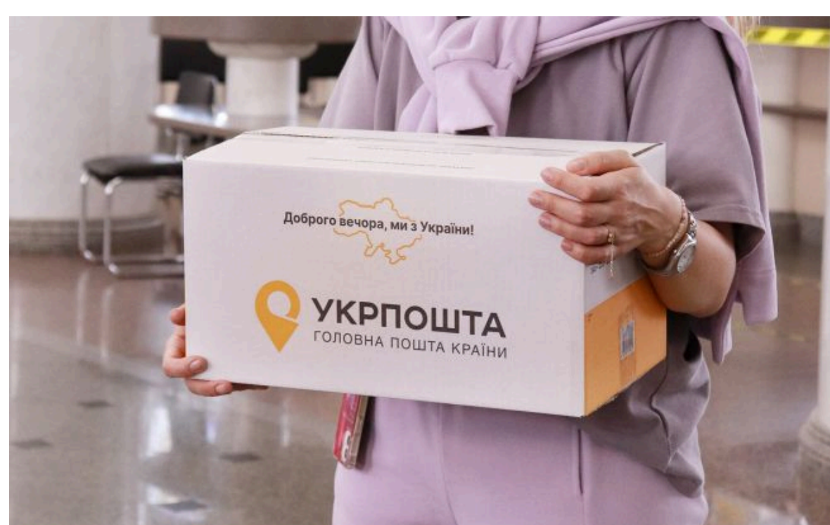
Фото: "Укрпошта" по-новому видаватиме посилки (facebook.com/ukrposhta)