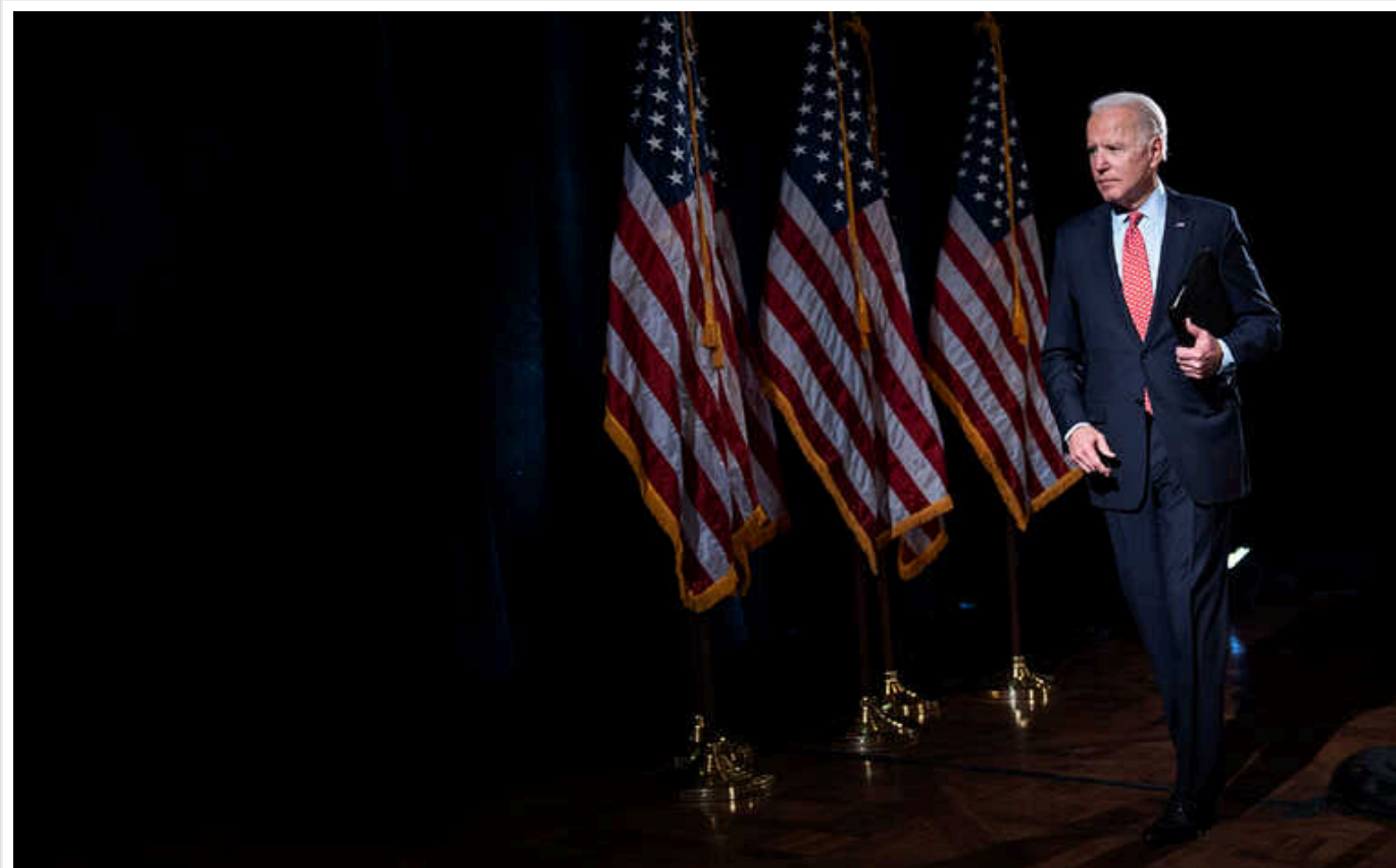
Адміністрація Байдена анонсувала новий пакет оборонної допомоги Україні

Цей пакет безпекової допомоги передбачає виділення додаткових 2,4 мільярдів доларів США в рамках Ініціативи з надання допомоги Україні у сфері безпеки (USAI).