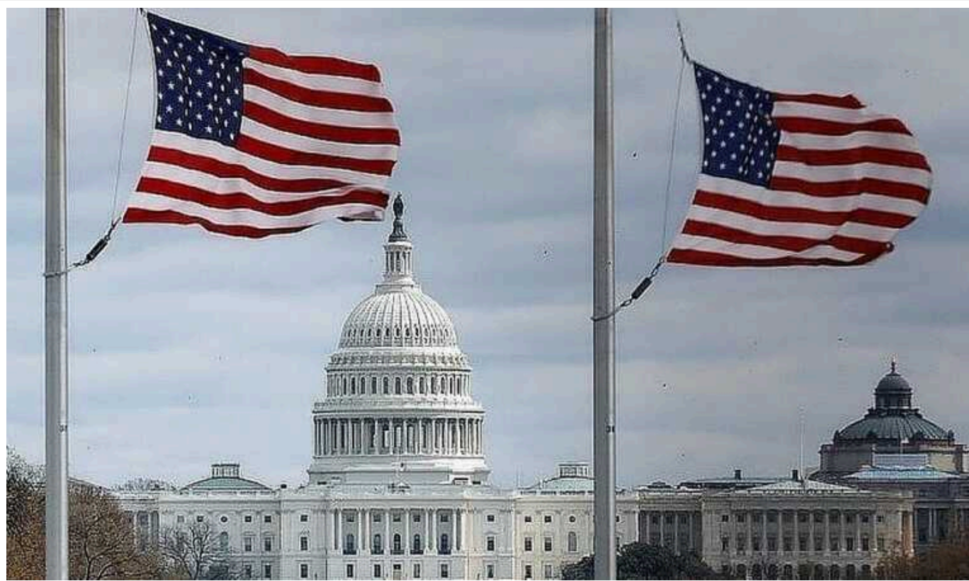
Змін у політиці США щодо використання Києвом далекобійної зброї не очікується, - Білий дім

Білий дім повідомив, що не очікується жодних оголошень про зміну політики США щодо використання Києвом далекобійної зброї за результатами зустрічі між Байденом і Зеленським.