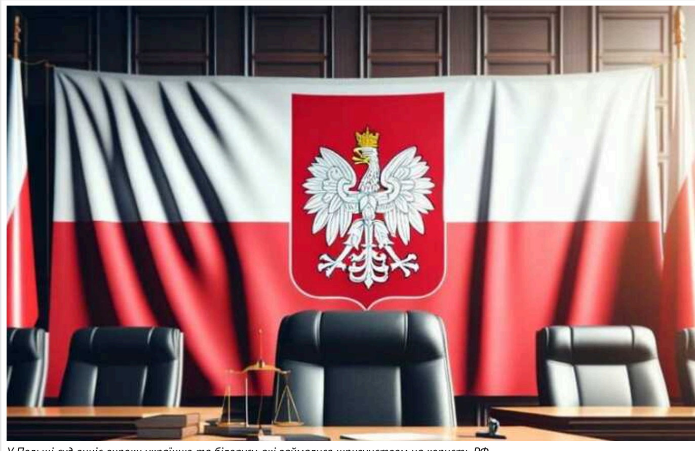
У Польщі суд виніс вироки українцю та білорусу, які займалися шпигунством на користь РФ

Суд у Любліні оголосив вироки двом чоловікам, українцю та білорусу, за шпигунство на користь Росії.