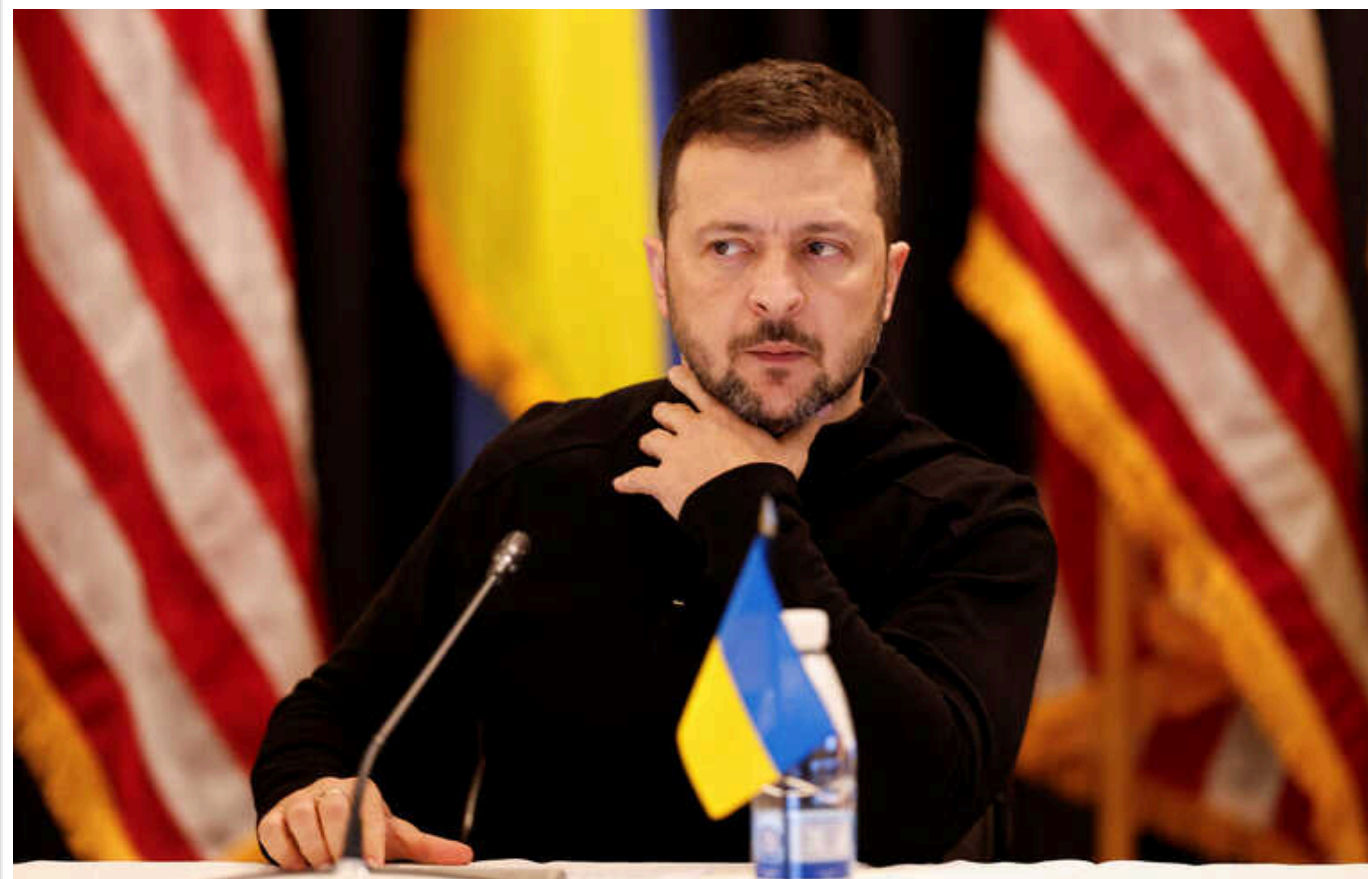
ЗМІ: Заходу слід переконати Зеленського відмовитися від плану повернути окуповані території силою, тому що в Україні немає на це сил і ресурсів

Згідно з виданням, Україні необхідне "щось значно більш амбіційне", ніж "план перемоги" Зеленського - "термінова переорієнтація". Оскільки українські оборонні лінії "можуть рухнутися раніше, ніж ресурси Росії вичерпаються". В той час як енергосистема вже в значній мірі знищена, втому Заходу наростає, а українське суспільство все менше вірить в можливість повної перемоги.