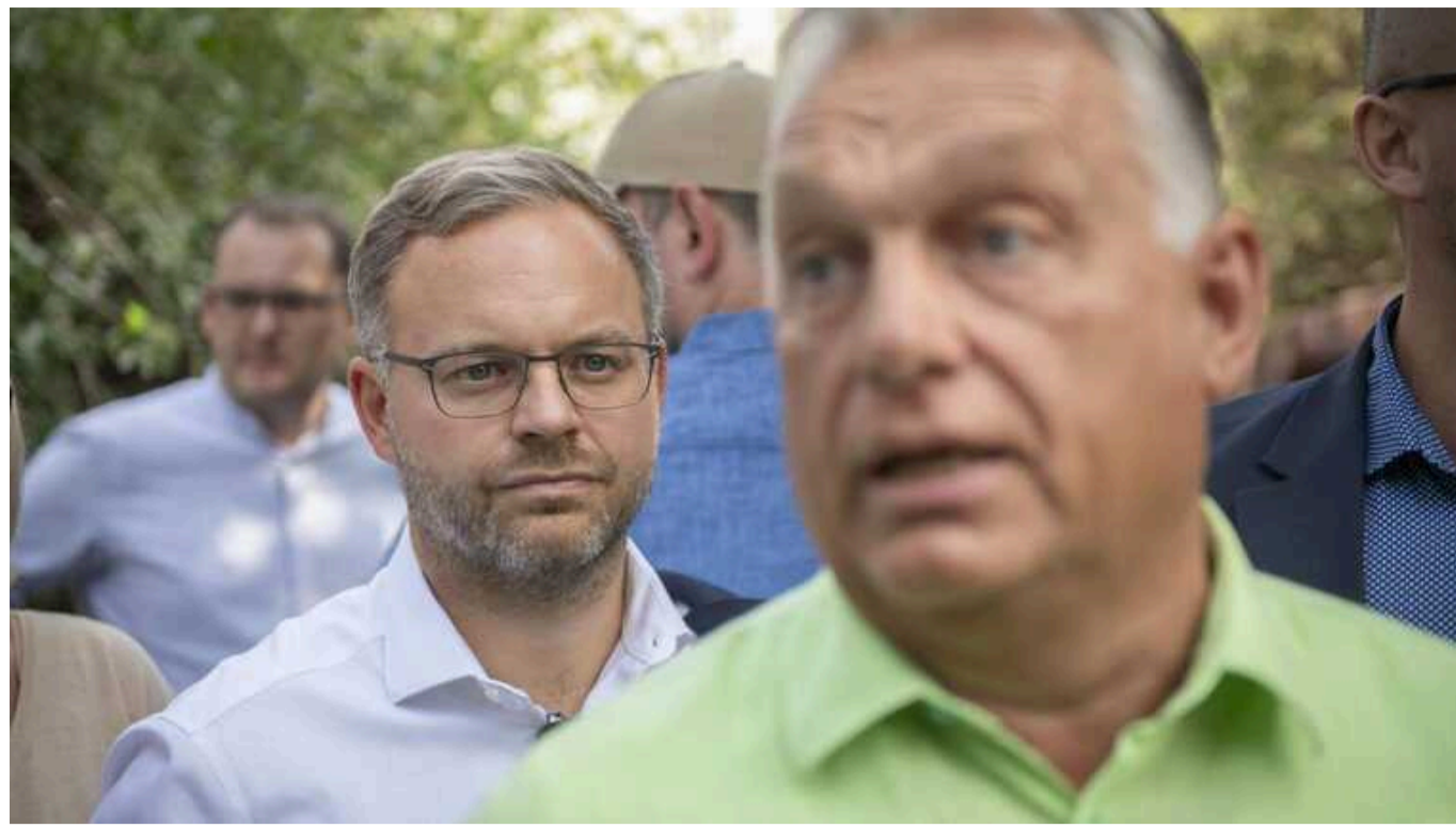
Угорщина у разі нападу не стала би оборонятись, як Україна, - Балаж Орбан

Політдиректор та близький радник угорського прем'єра Балаж Орбан викликав хвилю обурення серед угорців своєю заявою про те, що Угорщина у 1956 році не стала б вести оборонну війну, як це робить Україна, оскільки це "безвідповідально".