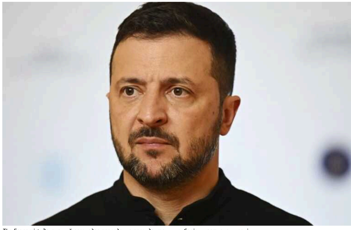
The Economist: Зеленський розглядає проведення президентських виборів у наступному році

В Україні в наступному році можуть відбутися президентські вибори, попри триваючу війну з Росією.