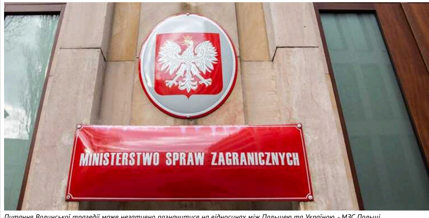
Питання Волинської трагедії може негативно позначитися на відносинах між Польщею та Україною, - МЗС Польщі

Таку інформацію озвучило польське Міністерство закордонних справ в інтерв'ю українським ЗМІ.