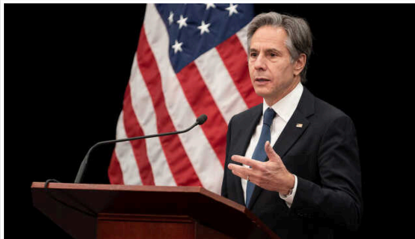
Блінкен засудив ядерні погрози Путіна – це абсолютно безвідповідально

Державний секретар США Антоні Блінкен розкритикував нещодавні дії російського керівництва в контексті ядерної зброї та назвав їх абсолютно безвідповідальними.