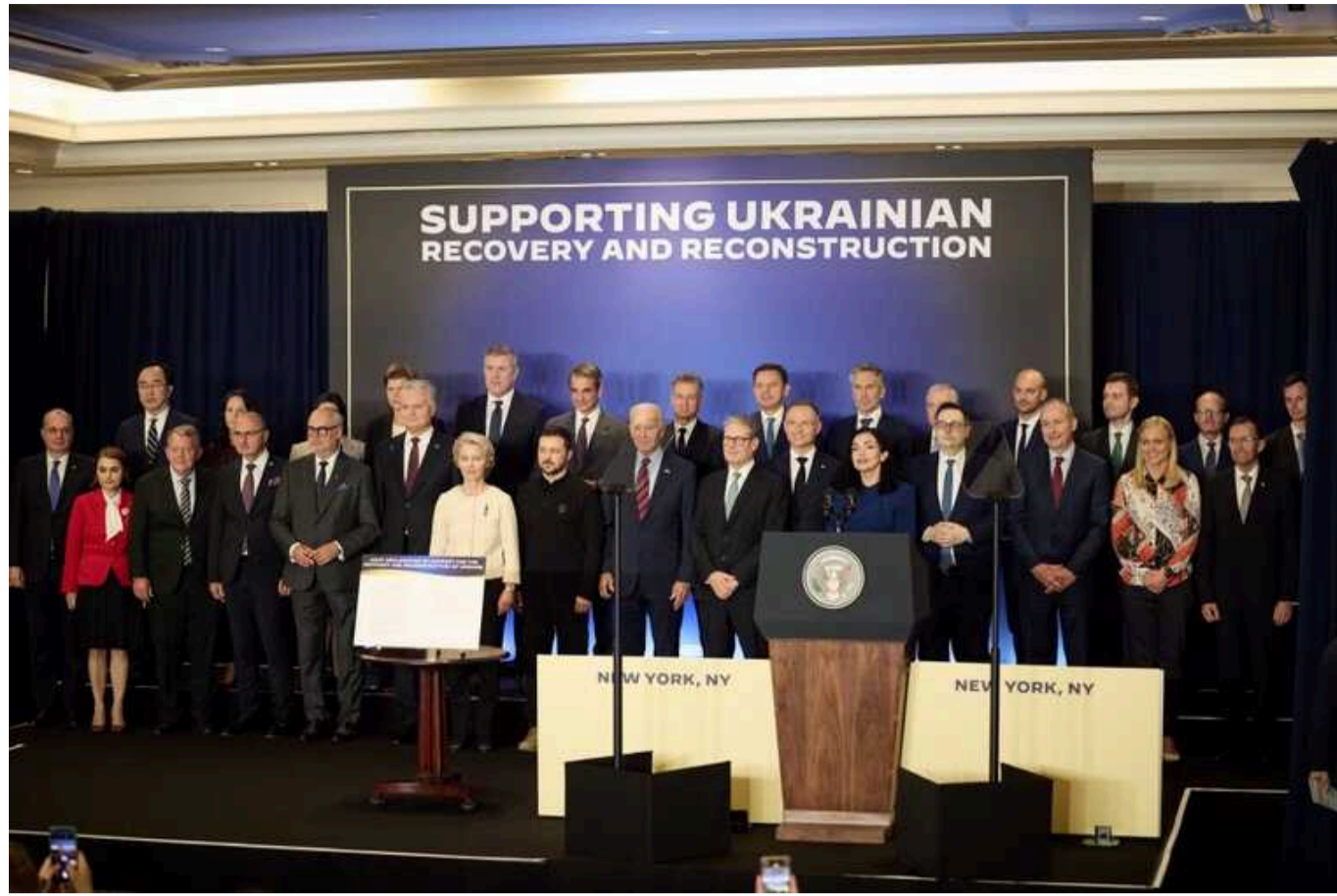
ЄС і понад 30 країн ухвалили декларацію про відновлення України

У Нью-Йорку відбулася зустріч у форматі «Група семи» плюс Україна», на якій понад 30 країн та Європейський Союз ухвалили Спільну декларацію про підтримку відновлення та реконструкції України, повідомив офіційний сайт президента України вночі 26 вересня.