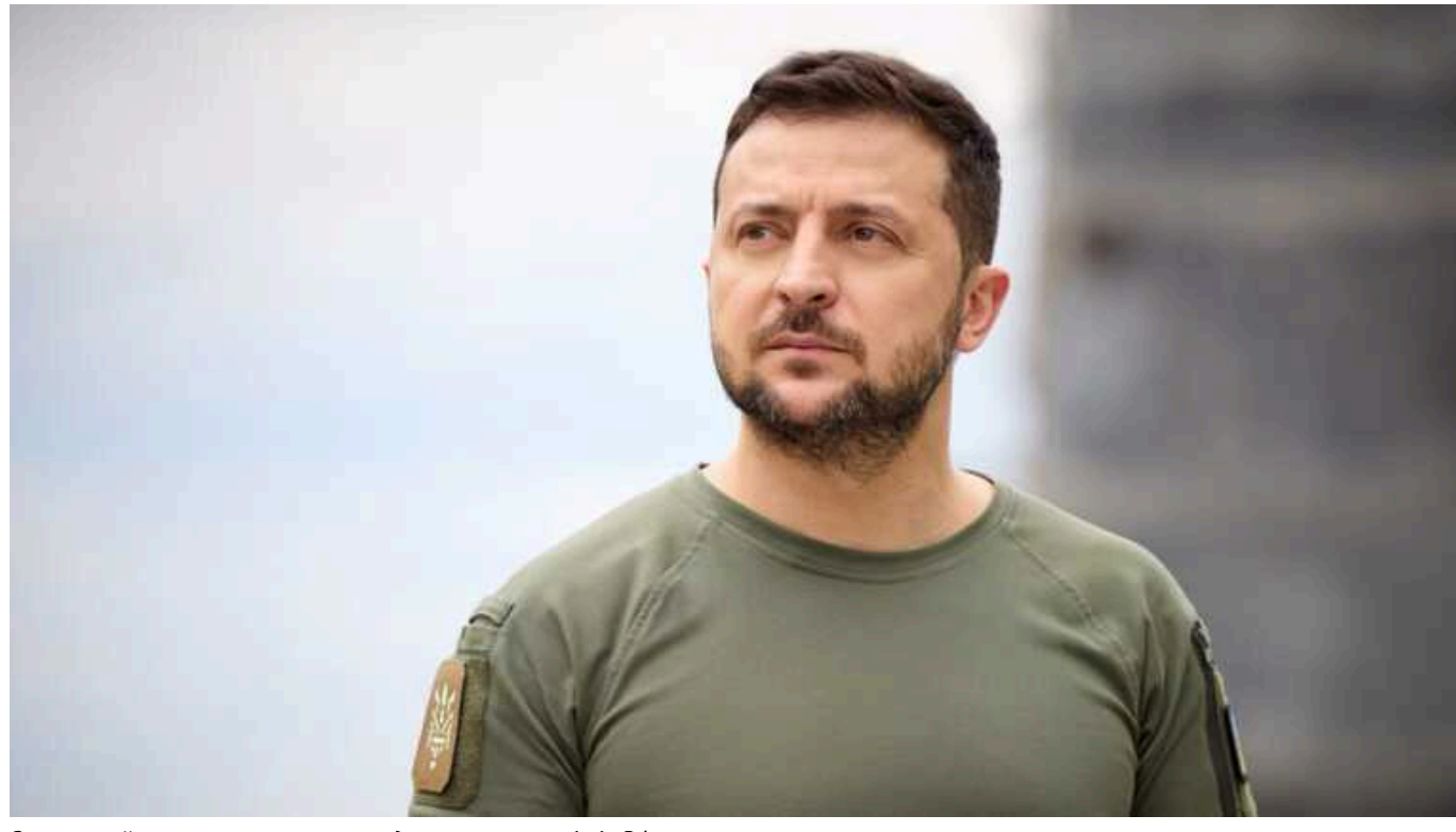
Зеленський виступив проти проведення переговорів із РФ

Зеленський виступає проти ведення переговорів з Росією для завершення війни в Україні.