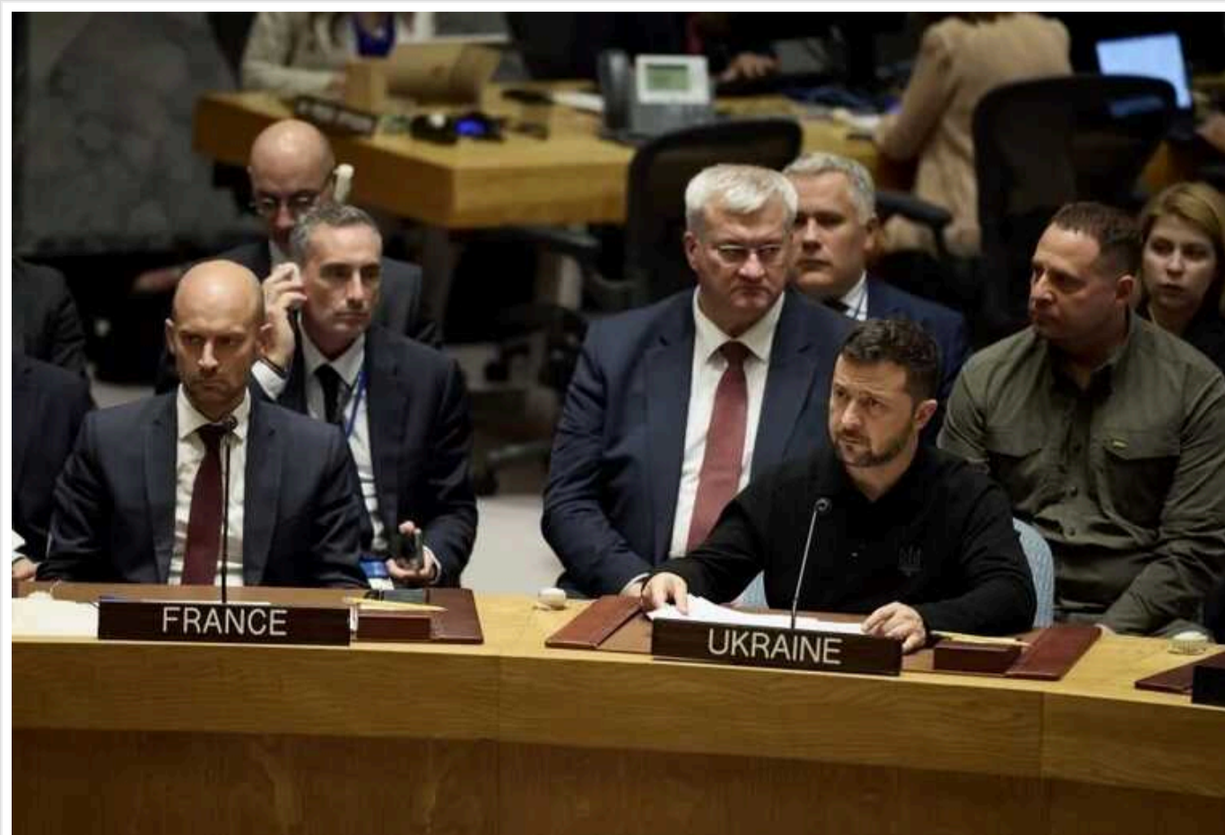
Зеленський виступив на засіданні Ради Безпеки ООН щодо ситуації в Україні

Президент України Володимир Зеленський виступив на засіданні Ради Безпеки ООН у вівторок, 24 вересня. Він підкреслив, що війну Росії проти України необхідно завершити, а не заморозжувати. Це відбудеться тоді, коли почне діяти статут ООН.