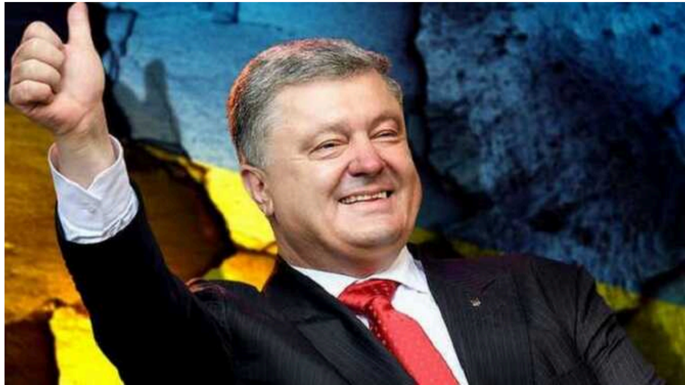
Росіяни внесли Порошенка з сином до реєстру "терористів та екстремістів"

Росфінмоніторинг заніс колишнього президента України Петра Порошенка та його сина Олексія до реєстру "терористів та екстремістів".