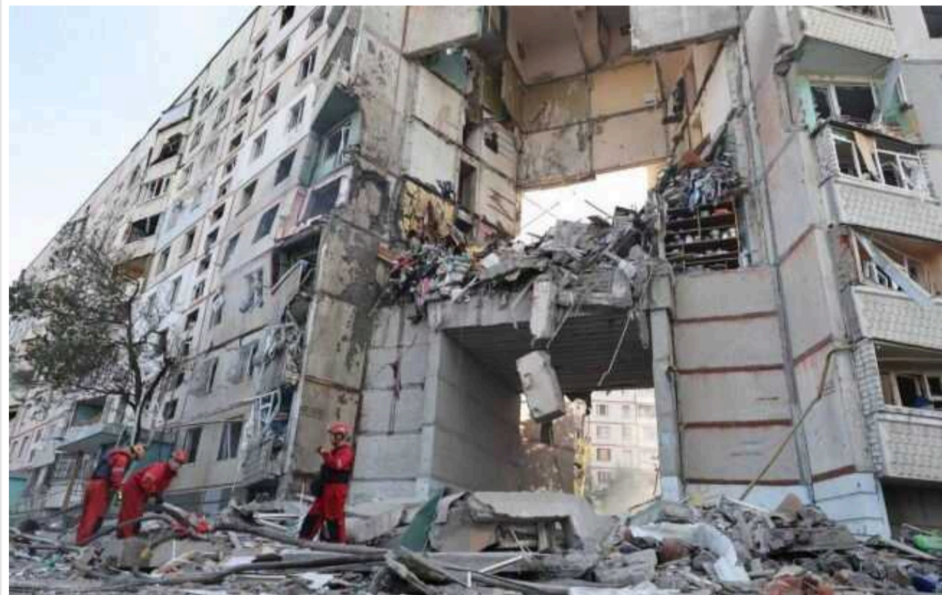
У Харкові повідомляють про трьох загиблих та 28 постраждалих

Три особи загинули, а 28 отримали травми внаслідок удару російських окупантів по Харкову у вівторок.