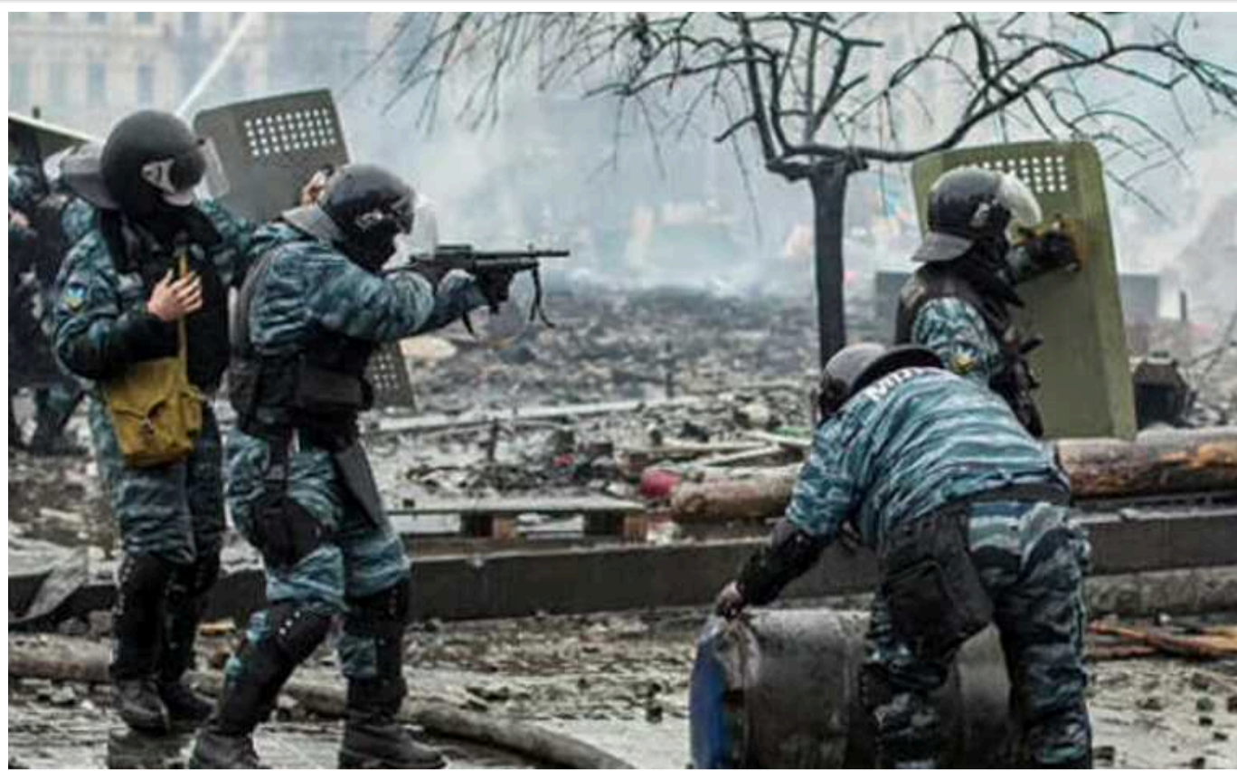
Справи Євромайдану: судитимуть екскерівників СБУ та 20 високопосадовців ФСБ РФ

Прокурори Офісу Генерального прокурора направили до суду обвинувальний акт щодо колишнього керівника СБУ, його першого заступника, начальника Департаменту захисту національної державності, а також директора і 20 співробітників ФСБ РФ за незаконне перешкоджання акціям протесту в 2013–2014 роках.