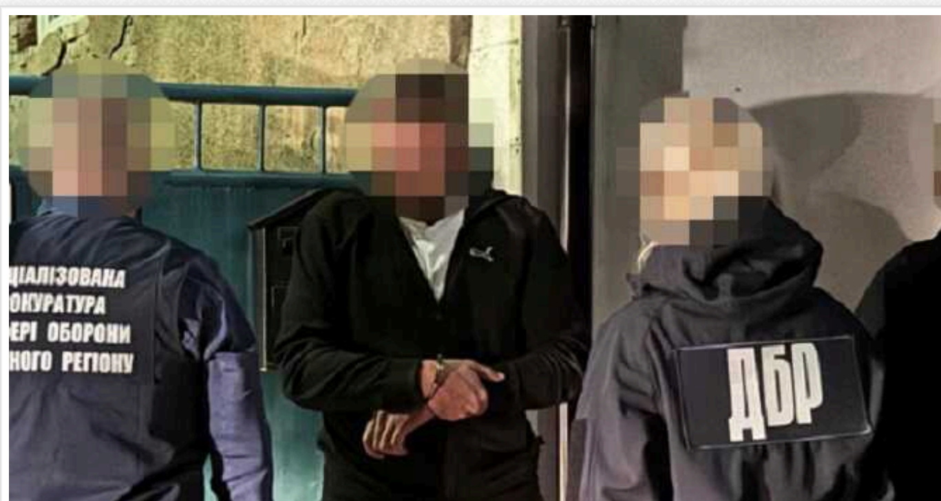
На Закарпатті викрили командира батальйону, який залишав військових служити в тилу за хабарі

Співробітники Державного бюро розслідувань у співпраці зі Службою безпеки України викрили командира батальйону однієї з військових частин, який вимагав гроші у своїх підлеглих за можливість залишитися служити на Закарпатті.