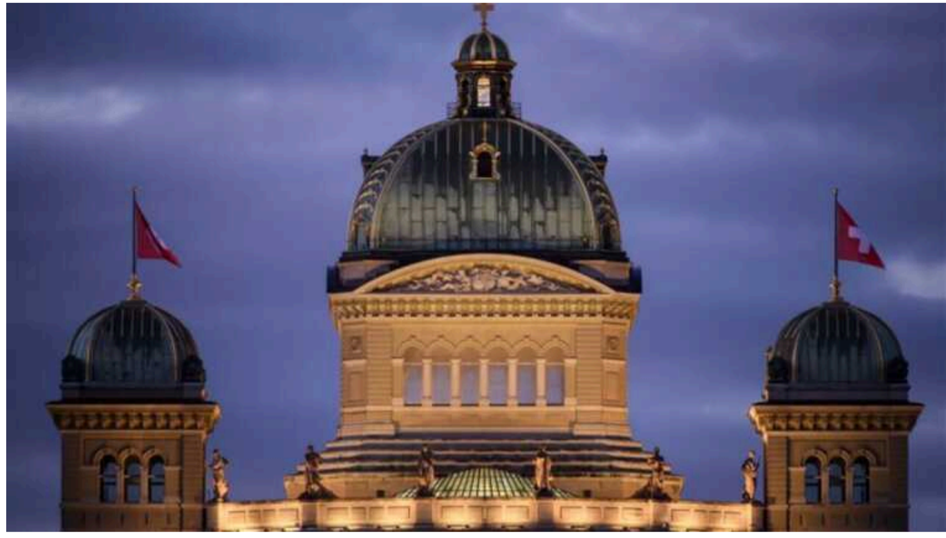
Швейцарський парламент визнав Голодомор геноцидом українського народу

Парламент Швейцарії визнав Голодомор 1932-1933 років геноцидом українського народу.