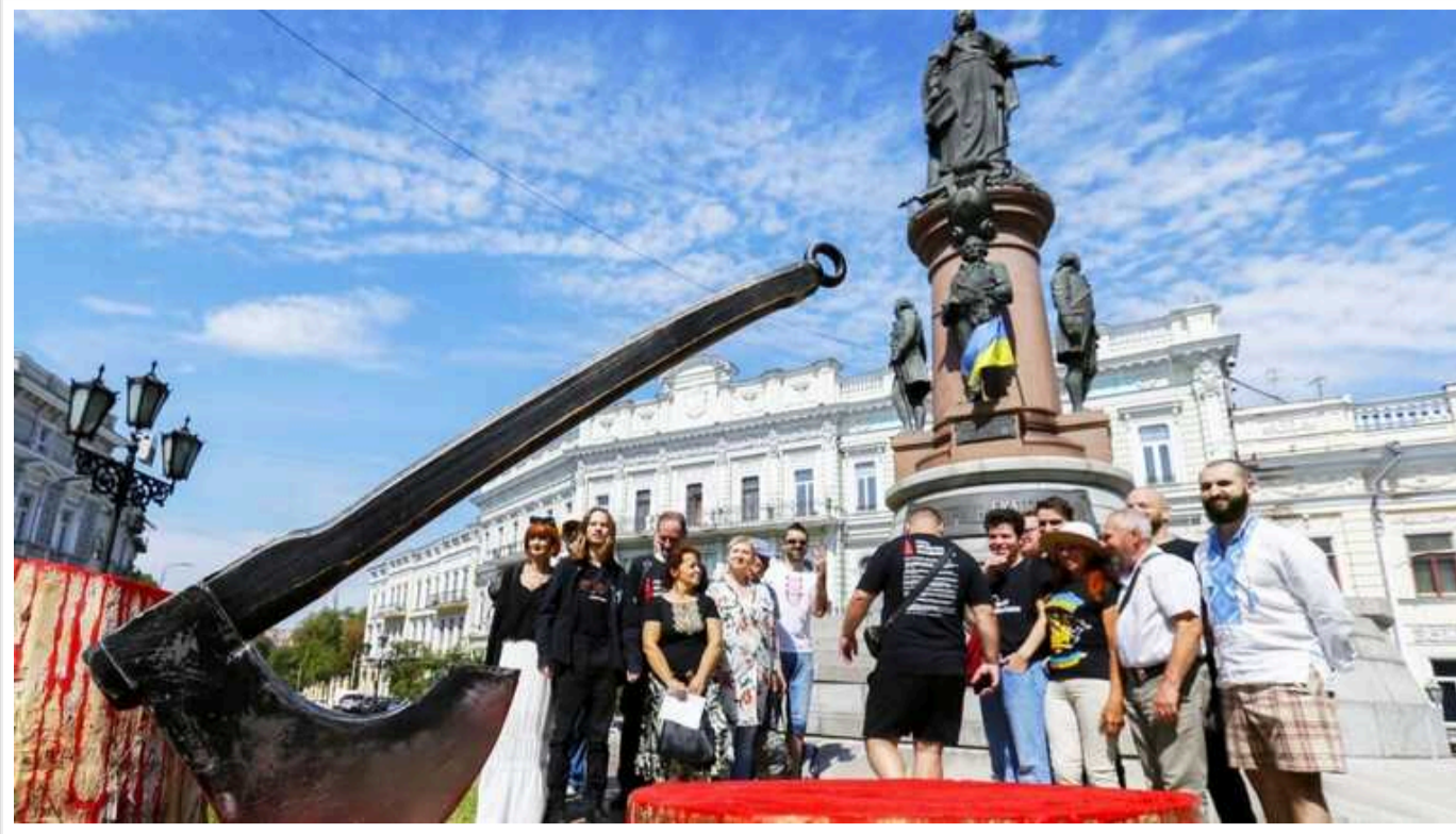
В Одесі планують демонтаж 19 пам'ятників

В Одесі планується демонтаж 19 пам'ятників. Їх список опублікований на сайті міської ради.